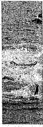
ディえ強風に ンよるコンデ コイション不 空。